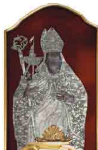
Šv. Mikalojus, Myros vyskupas, Europoje buvo garbinamas kaip keliautojų, pirklių, amatininkų ir vaikų globėjas

turėti lietuviškus maldos namus. Kol valdžia delsė, lietuviai ėmė rinktis apleistoje Šv. Mikalojaus bažnyčioje ir čia melstis. Galiausiai, 1901 metais, vyskupas skyrė bažnyčią lietuvių bendruomenei, kuri per trumpą laiką šventovę sutvarkė ir prikėlė naujam gyvenimui. Prie bažnyčios būrėsi lietuviai kunigai, inteligentai, buvo įsteigta mokykla, prieglauda, savitarpio pagalbos draugija.