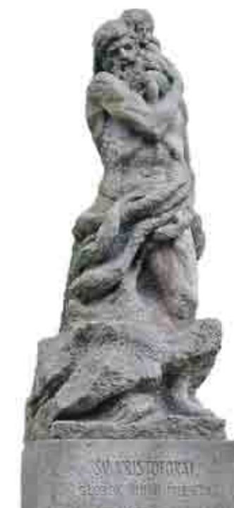
Šv. Kristoforas, 1957–1959 © Antanas Kmieliauskas (ATGA, A. 2021)

Rimtesnės rekonstrukcijos Šv. Mikalojaus šventovei prireikė po 1749 m. gaisro. Tuomet buvo padidinti šoniniai langai, įrengtas baroko stiliaus choras ir trys altoriai. Vėliau pristatyta nauja zakristija, o XVIII a. sumūrytas varpinės bokštas