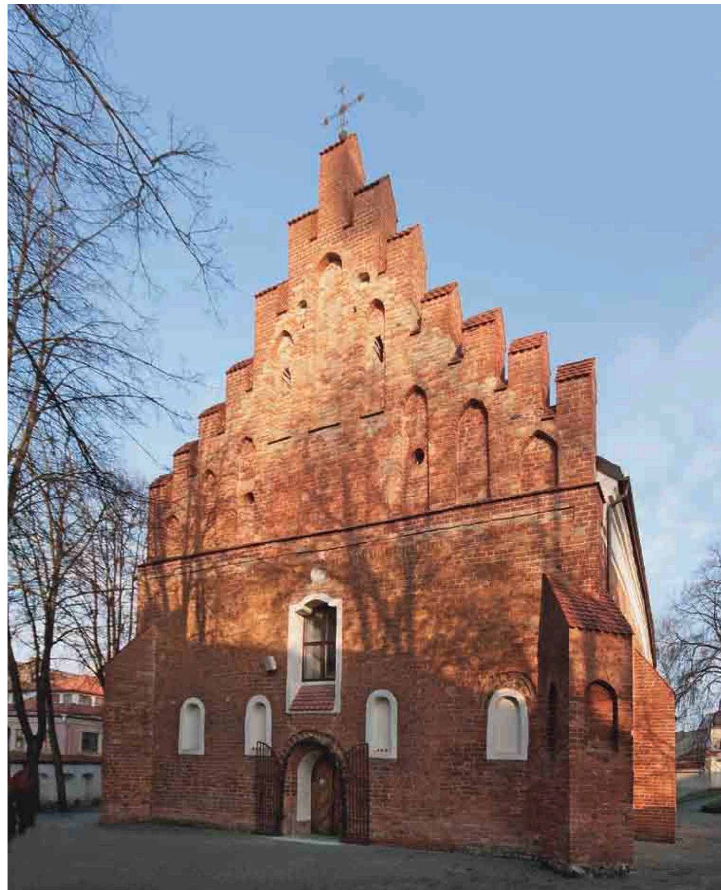
ŠV. MIKALOJAUS BAŽNYČIA

1864 metais, uždarius brolių pranciškonų vienuolyną, Šv. Mikalojaus bažnyčia atiteko Šv. Jono parapijai. Žiaurios carinės priespaudos laikais neprižiūrimas bažnyčios pastatas apgriuvo. XIX a. pabaigoje Vilniuje susitelkusi lietuvių bendruomenė pradėjo žygius, kad gautų leidimą