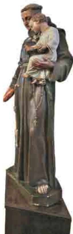
VILNIAUS ŠVENTOVĖS XIV–XV A.