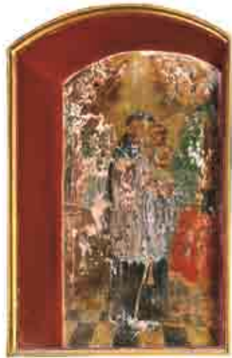
XX a. pabaigoje, restauruojant bažnyčią, po tinko sluoksniu rasta XVIII a. vidurio sienų tapybos (Viršuje)